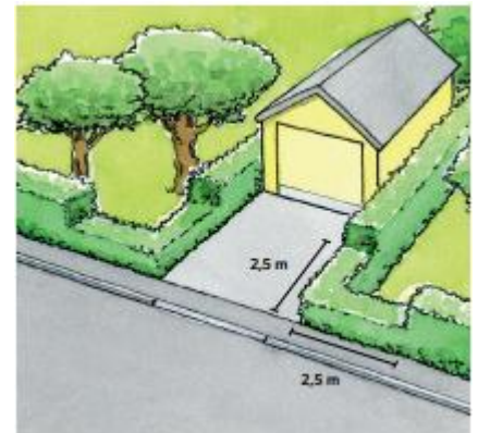
Max 80 cm högt